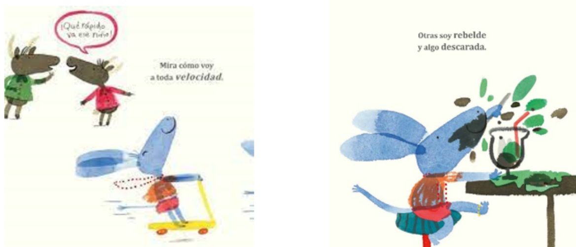
Figura 3. Selección de escenas de “Soy una niña”

Fuente: Yasmee Ismail, 2016. Editorial Corimbo.