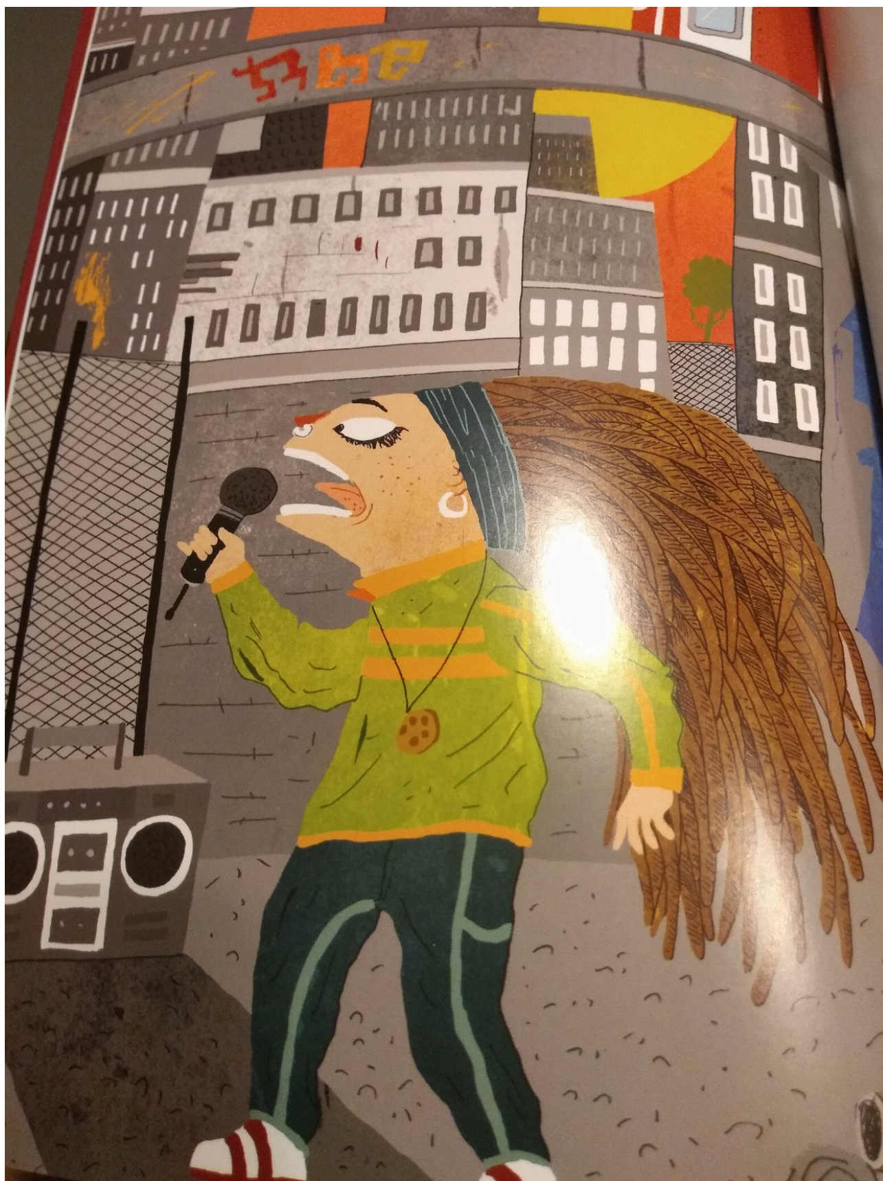
Figura 6. Imagen de La rapera Rap-unzel en “Cuentos del mundo en décimas chilenas”