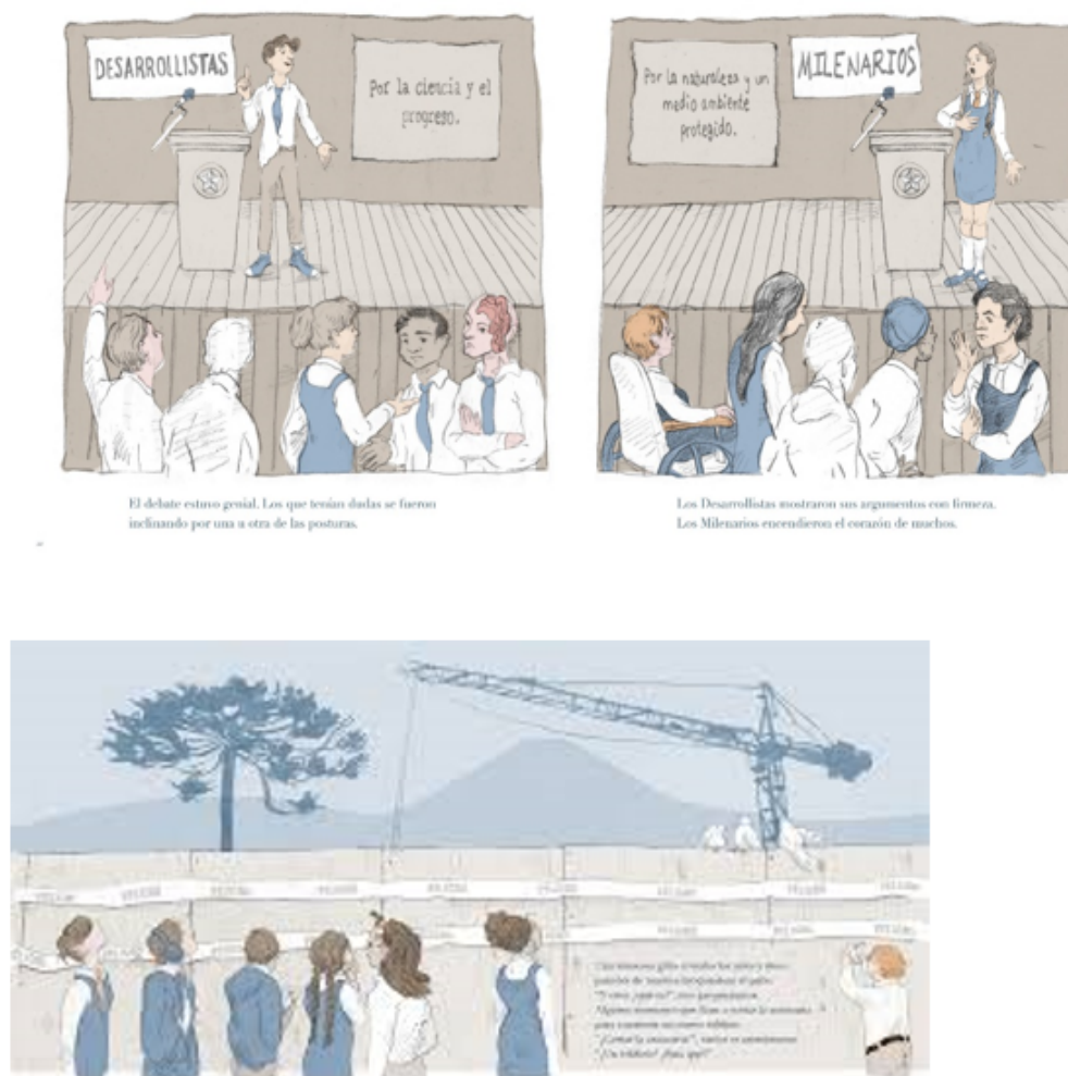
Figura 5. Selección de escenas de “Pequeña historia de un desacuerdo”

Fuente: Gabriela Lyon, 2017. Ediciones Ekaré Sur.