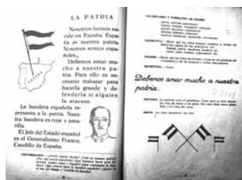
Imagen 4: Maillo, 1956:40-41

7 Sánchez-Redondo defiende que el patriotismo de Maillo comprende tres elementos: un componente intelectual («la comunidad nacional como unidad de destino histórico»), un componente afectivo («cálida emoción de los valores españoles pretéritos y actuales») y un componente volitivo («sistema amplio y exigente de deberes en que ha de traducirse el patriotismo activo, único verdadero»). Afirmamos esta tesis: en nuestra selección de fragmentos de textos que atestiguan el valor del patriotismo en las obras de Maillo, se pueden reconocer cada uno de los tres componentes (Sánchez-Redondo Morcillo 2004:189-190).