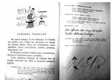
Imagen 6: Maíllo, 1956:96-97